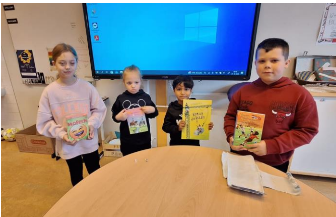
De boekenmarkt voordat de kijkavond begon...

Wat was het een gezellige drukte op de Kijkavond in de Kinderboekenweek. Het hele gebouw was open; beide scholen en de peutergroepen! In de grote zaal konden alle kinderen een leuk boek uitzoeken op de boekenruilmarkt. Tijdens de kijkavond in de Kinderboekenweek werd er in alle lokalen hard gezocht naar foto's van juffen en meesters met hun lievelingsboek...maar welk boek was dat dan? Daar moesten ze wel even over nadenken! Uit alle ingeleverde formulieren zijn 4 winnaars getrokken, gefeliciteerd!