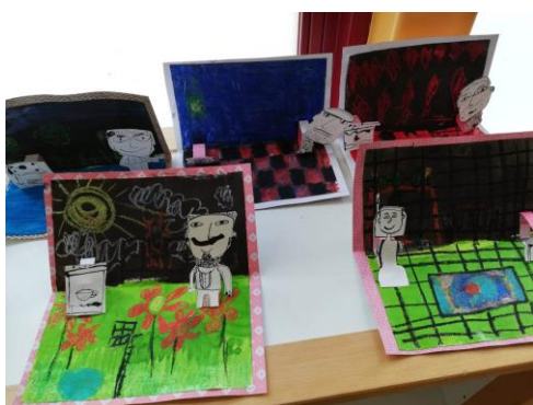
Het resultaat: 3D-schilderijen.

Vriendelijk groet, Team obs Het Spectrum